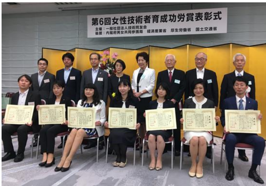
表彰式 2019年8月8日 経団連会館にて（前列左から3人目が受賞者）