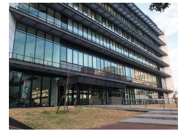
熊本市上下水道局庁舎

所在地 熊本市中央区手取本町1番1号 人口 738,567人 (2020年10月1日現在) 世帯数 330,788世帯 (2020年10月1日現在) 職員数 8,553名 (2020年4月1日現在)