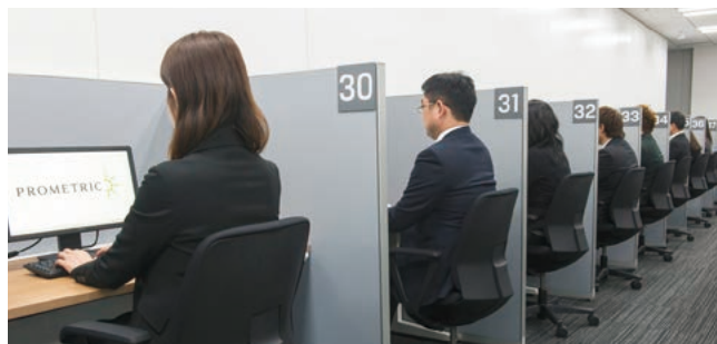
試験会場イメージ

日立はプロメトリック社と協力しiパス試験会場の運営も行っています。