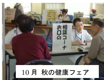
10月 秋の健康フェア