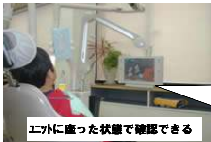
エントに座った状態で確認できる

今までよりも更に一歩進んだ診療が提供できるよう歯科外来スタッフ一同努めてまいります。