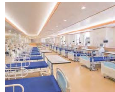
▲ 腎臓病・生活習慣病センター内