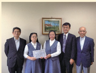
聖嬰会 平野施設長