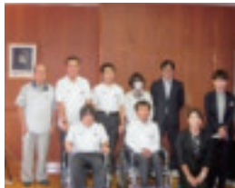
あいの里高等支援学校