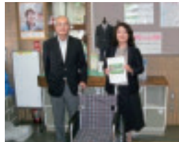
札幌伏見支援学校