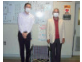
白樺高等養護学校