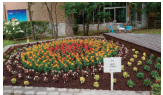
寄贈：親切会の看板を設置して頂きました