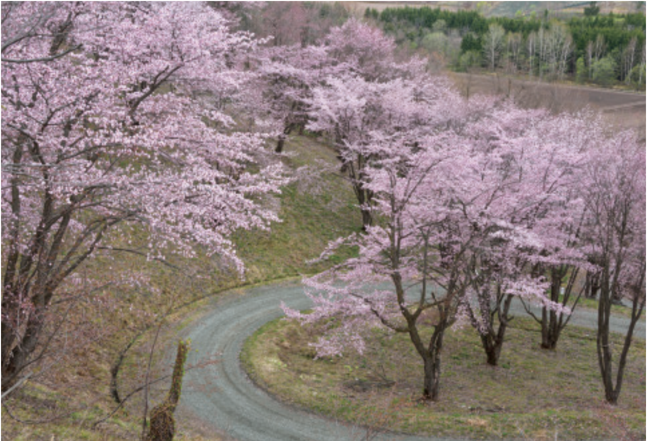
深山峠の桜(上富良野町)