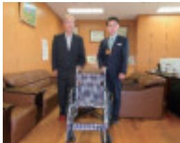
札幌高等養護学校