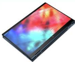
タブレットモード

タッチディスプレイが360度開閉可能となっており、さまざまなシーンに合わせ、ノートパソコン、タブレットモードの他に渉外営業に向くフラットモード、画面共有や外付けのフルサイズキーボード使用時に便利なテントモード、スタンドモードと5つのモードに変化が可能です。