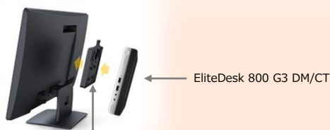
HPフラットパネルモニターQuick Release または EliteDisplay用ダイレクトマウントブラケット

※VESA規格では液晶モニターをアームやスタンドに取り付ける際の寸法についての国際規格を定めています。