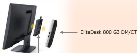
HPフラットパネルモニターQuick Release または EliteDisplay用ダイレクトマウントブラケット

※VESA規格では液晶モニターをアームやスタンドに取り付ける際の寸法についての国際規格を定めています。