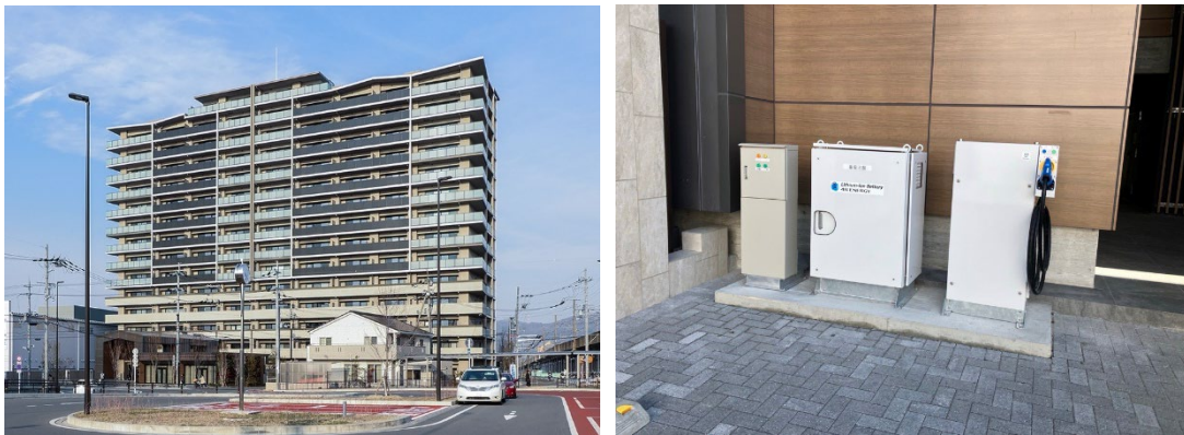
「シエリアシティ星田駅前」の外観(左)と V2X システム(右)

太陽光発電で電気自動車・蓄電池を充電し、停電時は蓄電した電気でエレベーターの利用が可能