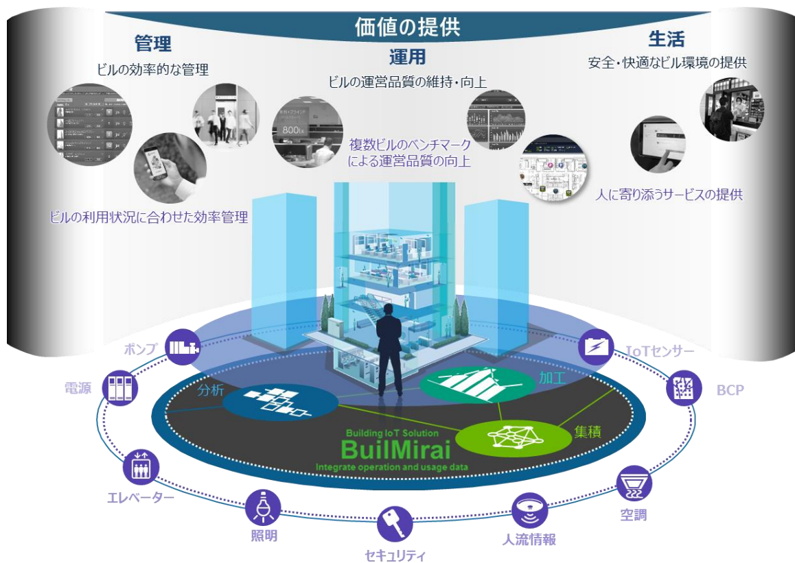
本プロジェクトにおける「BuilMirai」活用のイメージ

また、オープンな API(Application Programming Interface)による柔軟なサービスの拡充と継続的なソリューションのアップデートにより、ビル全体の価値向上に貢献し、ビル利用者一人一人が気持ちよく過ごせるビルの実現に貢献していきます。