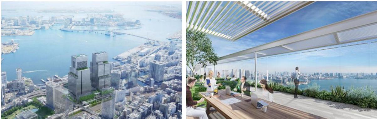
芝浦プロジェクト：イメージパース

野村不動産株式会社(以下、野村不動産)は、このたび、国家戦略特別区域計画の特定事業である「芝浦プロジェクト(以下、本プロジェクト)」において建設を進めるツインタワーのうち、2025年2月竣工予定のS棟に導入するビル OS*として、株式会社日立製作所(以下、日立)のビル IoT ソリューション「BuilMirai(ビルミライ)」を採用することを決定しました。野村不動産は、今後、日立の協力の下、本プロジェクトのDXの取り組みの中核として「BuilMirai」を継続的に活用し、ビルの高付加価値化を実現します。