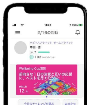
ハピネスプラネットアプリ