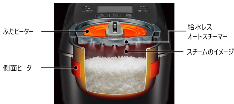
〔図 4 スチーム保温のイメージ〕

「スチーム保温」は、炊飯中に発生する蒸気を「給水レス オートスチーマー」にため、保温時にスチームにして送り込みます。今回、側面ヒーターとふたヒーターの出力をコントロールすることにより「給水レス オートスチーマー」にたまる水分量を増やし、保温時にスチームにして送り込む時間を長くすることで、ごはんをしっとり保ちます。保温時間は従来と同様に最大 40 時間([保温低]設定時)です。(図 4)(図 5)