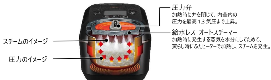
[図 1 極上ひと粒炊きの炊飯イメージ(圧カスチーム蒸らし時)]

「極上新米」コースは、八代目儀兵衛の職人の技を取り入れ、圧力加熱のかけ方を工夫して火力を変えるとともに、浸しやすスチーム蒸らしの時間を調整します。いつもの水加減で、新米のもつハリやツヤを生かしながら「外硬内軟」に炊き上げます。