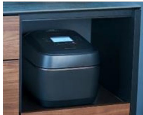
〔図 3 スライド式の棚の中でも使える〕

本製品は、炊飯時に発生する蒸気を本体内にためておき、蒸らし時の高温スチームとして利用します。本体内にためておくことで炊飯中の蒸気がほとんど出ない (*4) ことから、例えばスライド式の棚の中で利用しても蒸気がこもらないため、炊飯器の置き場所に困りません。(図 3)