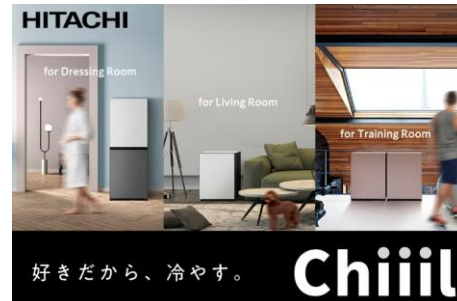
利用シーンのイメージ

日立グローバルライフソリューションズ株式会社は、リビングや寝室などキッチン以外に置いたり、複数台を組み合わせた (*)1 、生活スタイルや好みにより自由に使える新コンセプト冷蔵庫「Chiil(チール)」の開発を進めています。そのマーケティング活動の一環として、カルチャ・コンビニエンス・クラブ(CCC)グループの株式会社ワンモアが運営するクラウドファンディングサイト「GREEN FUNDING」で、本日12月27日より先行予約の受付を開始します。