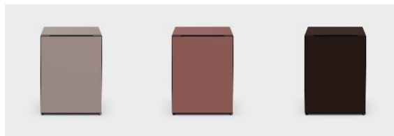
トープ(T) ブリック(R) ウェンジ(DT)