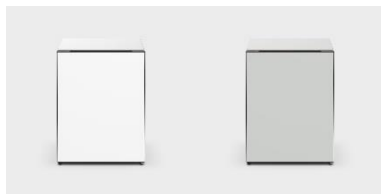
ホワイト(W) ノルディック(LH)