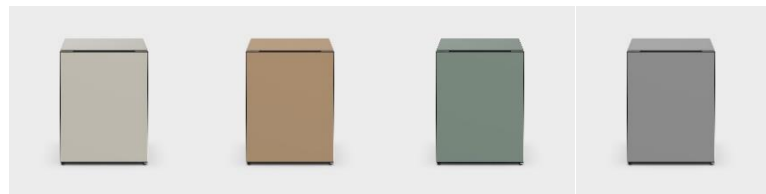
クレージュ(C) オーク(Y) モス(G) グラファイト(H)