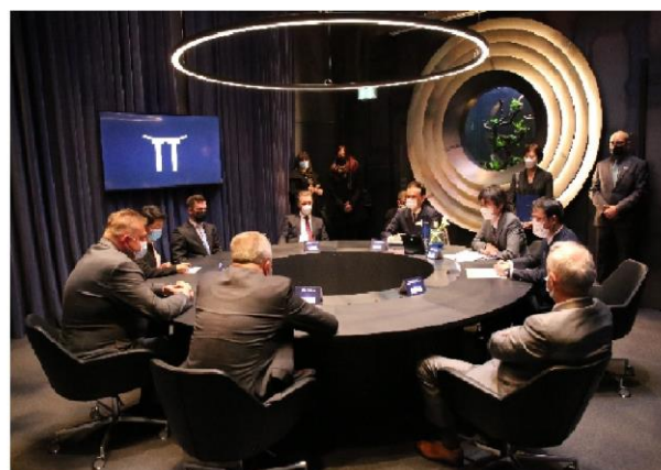
図3 オンラインで開催した運転開始式