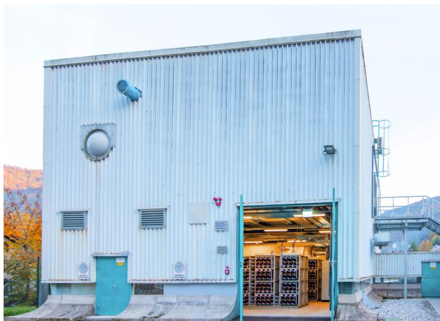
図1 実証運転を開始した、イドリア市内の配電系統に設置した蓄電池システム

また今後、本実証成果の分析・評価結果をもとに、第 1 フェーズ(2019 年終了)で実証事業が完了したクラウド型統合配電管理システム(DMS)とともに、AEMS をサービス形態で提供し、欧州を中心としたビジネスモデルとして展開することを検討していきます。