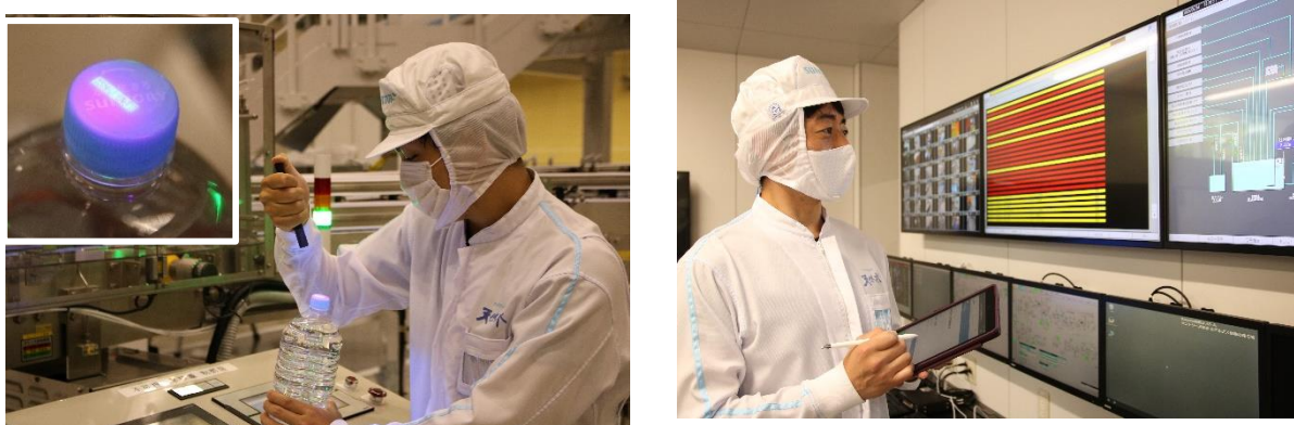
新工場における IoT 基盤を活用した DX

工場内データを統合・利活用し、全体最適かつ進化し続ける次世代ファクトリーモデルをめざす