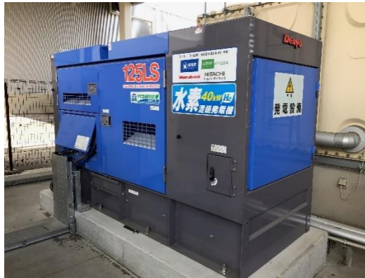
追加した水素混焼発電機の外観