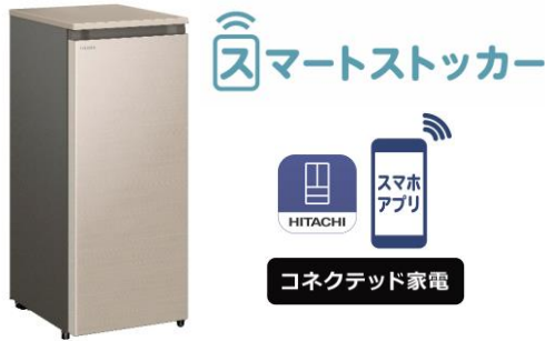
「スマートストッカー」R-KC11R