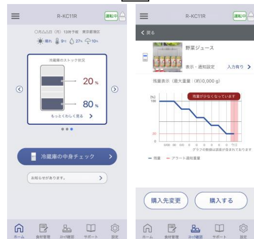
[アプリの画面イメージ]

本製品は、「日立冷蔵庫コンシェルジュアプリ」によりスマートフォンと連携し、食品のストック管理や購入をサポートします。ストック管理したい食品を登録すると、庫内の2段目と5段目に搭載した重量センサーで、重さを検知し (*) ストック状況をスマホに表示します。また、食品が少なくなってきたら「ホーム画面」に通知し、お知らせします。なお、事前によく使用する購入先を登録すれば、アプリの「購入する」ボタンから登録したECサイトに移動し、スムーズに買い物もできます。