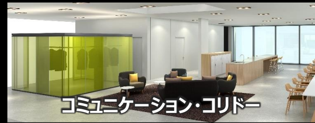
コミュニケーション・コリドー