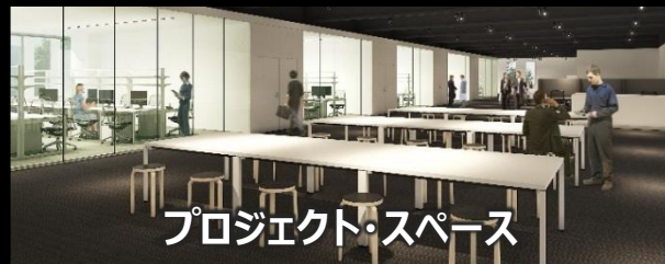
プロジェクト・スペース