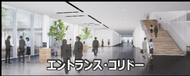
エントランス・コリドー