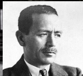
日立研究所 初代所長 中央研究所 初代所長 馬場桑夫