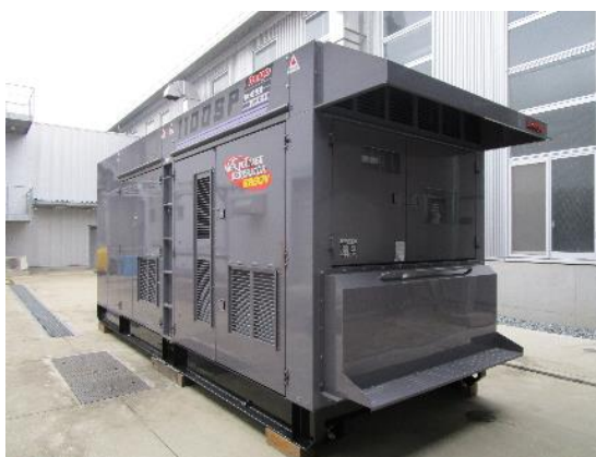
水素混焼ディーゼル発電機外観