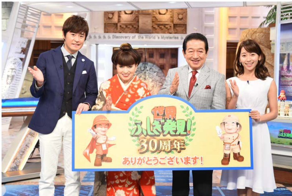
日立 世界ふしぎ発見！

日立グループは、このたび「日立 世界ふしぎ発見！」放送開始 30 周年を記念した 2 時間スペシャルにて、番組とコラボレーションした特別 CM を放映します。