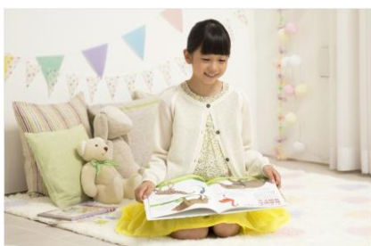
【図1 まなびのあかり使用時】

こども部屋向けの製品には、新開発の『まなびのあかり』を搭載しました(図1)。一般的なLEDシーリングライトの光は、太陽光の波長成分に比べて、青緑色と赤色の成分がやや不足しています。『まなびのあかり』は、主光源の昼光色と電球色のLEDに加え、青緑色と赤色のLEDを追加(図2)することで、より太陽光に近い波長成分とし、明るさを全灯の1.2倍にアップしました。これにより、全灯の平均演色評価数 (*)2 Ra85に対しRa92の高い演色性を実現し、文字が見やすく、色鮮やかに見えるようになります(図3)。