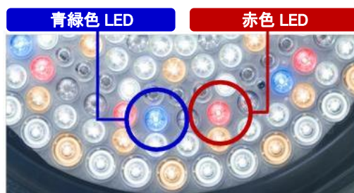
【図2 カバーを外した点灯状態】