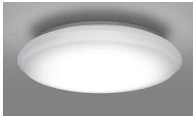
『まなびのあかり』搭載タイプ LEC-AH802FM