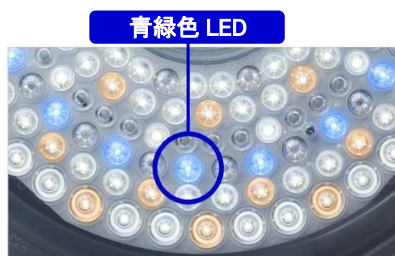
[図 8 カバーを外した点灯状態]