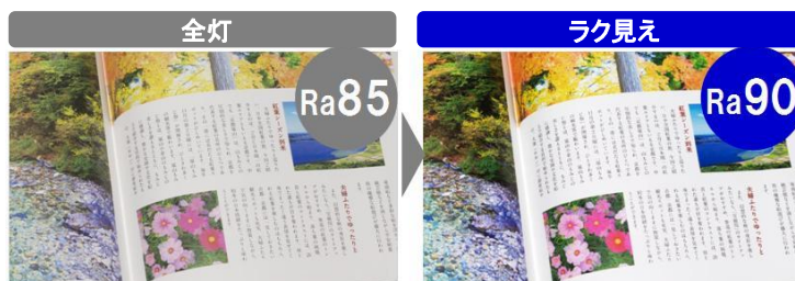
[図 9 全灯とラク見えの見え方の比較]