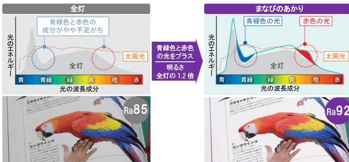
【図3 全灯とまなびのあかりの波長成分・見え方の比較】