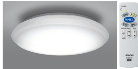
『深夜灯』搭載タイプ LEC-AH801FS

日立アプライアンス株式会社(取締役社長:二宮 隆典)は、『まなびのあかり』を搭載したこども部屋向け「LEDシーリング」2機種と、『深夜灯』を搭載したシニアの寝室向け「LEDシーリング」2機種、合計4機種の個室向け「LEDシーリング」を9月12日から発売します。