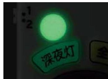
[図 6 深夜灯ボタンと蓄光シール]