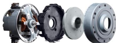
[図1] 小型・軽量ハイパワーファンモーター

本製品は、流体解析技術により送風機効率向上を図った「小型・軽量ハイパワーファンモーター」(図 1)と形状最適化により空気の流れを徹底的にスムーズ化した日立独自の集じん部「パワーブーストサイクロン」(図 2)を搭載しました。これにより、小型・軽量ボディで従来製品 (*) に比べ吸込仕事率を 10W アップさせた 440W の強い吸引力を実現し、じゅうたんのごみも、よりスッキリ吸い込みます。