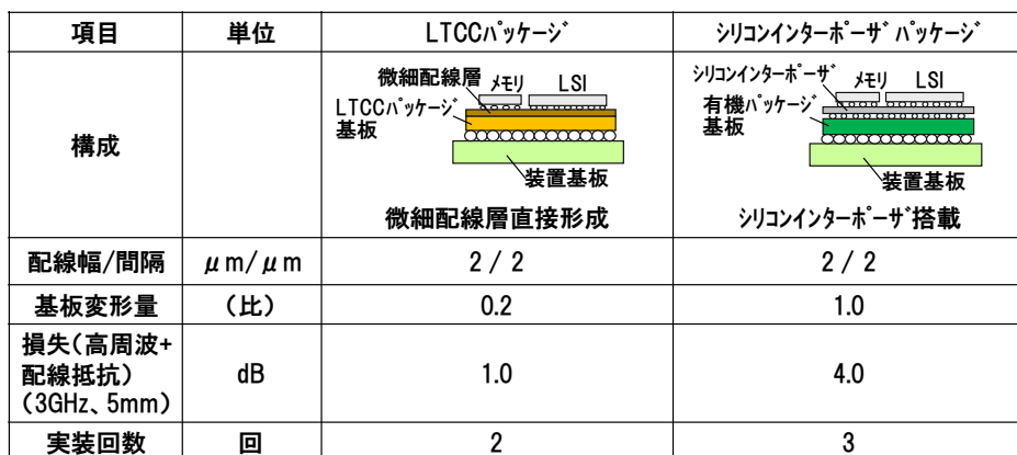
表 1 今回開発した LTCC パッケージとシリコンインターポージャ パッケージとの比較