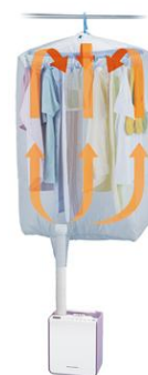
〔図11 衣類乾燥イメージ〕