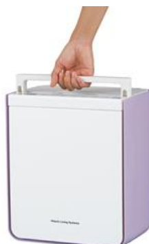
〔図13 本体ハンドルイメージ〕