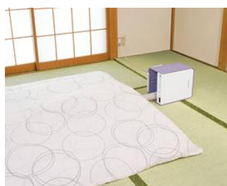
[図 6-1 置き方イメージ(タテ置き)]