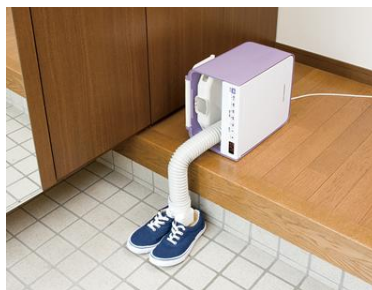
〔図10 くつ乾燥イメージ〕