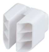
〔図9 くつ乾燥アタッチメント〕