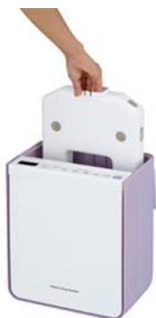
〔図12 アタッチメント収納イメージ〕