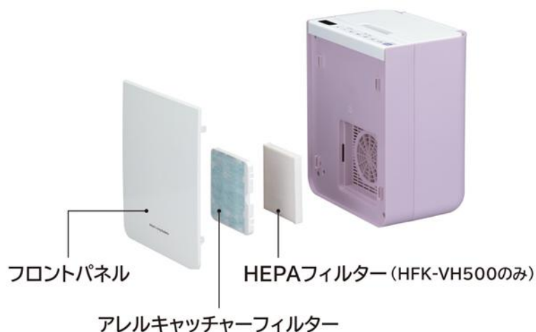
[図8 吸気フィルターイメージ]

*9 ●試験機関：一般財団法人 ボーケン品質評価機構 ●試験方法：ハロー試験 ●抗菌方法と場所：吸気フィルターに防カビ剤を加工 ●試験結果：カビの生育を認めない。