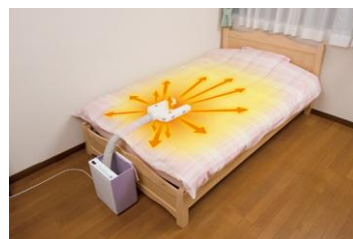
[図 1 ふとん乾燥アタッチメント]