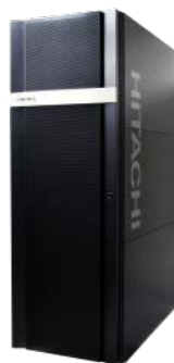
日立統合プラットフォーム「Hitachi Unified Compute Platform」

株式会社日立製作所(執行役社長:中西 宏明/以下、日立)は、このたび、IT システムの迅速かつ容易な構築、運用を実現する日立統合プラットフォーム「Hitachi Unified Compute Platform(日立ユニファイドコンピュータプラットフォーム)」(以下、UCP)において、デスクトップ仮想化環境(以下、VDI *1 )の構築向けに、「Hitachi Unified Compute Platform かんたん VDI モデル」(以下、UCP かんたん VDI モデル)を製品化し、10月4日から販売を開始します。本製品は、VDIに必要なハードウェアやソフトウェアを組み合わせ、基本設定を済ませた状態で提供するもので、仕様検討から構築にかかる期間を5ヶ月から2ヶ月へと約60% *2 短縮できるほか、サポートサービス内容の充実により導入後の容易な運用を実現します。