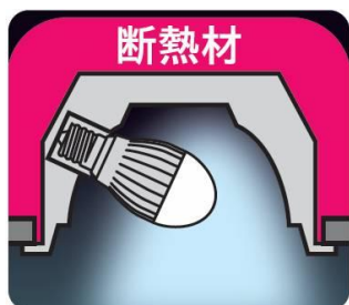
[図 1 断熱材施工器具装着イメージ図]

(*2) 断熱材施工器具や密閉形器具の種類によっては、器具内の温度や周囲温度が高くなると保護回路が働き自動的に電力をおさえるため、明るさが低下する場合があります。浴室では必ず防湿形器具をご使用ください。