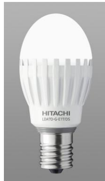
LDA7D-G-E17/DS 小形電球形(E17 口金)

日立アプライアンス株式会社(取締役社長:山本 晴樹)は、断熱材施工器具や密閉形器具でも使える LED 電球「小形電球形(E17 口金)広配光タイプ」のラインアップ拡充として、調光器にも対応した LDA7D-G-E17/DS(昼光色相当)及び LDA7L-G-E17/DS(電球色相当)の 2 機種を 10 月 19 日から発売します。