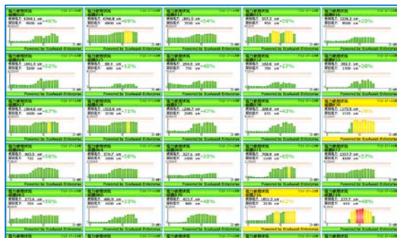
拠点別の見える化画面例

これにより、全社および拠点ごとのエネルギー使用状況を把握できるだけでなく、節電に対する課題の早期把握や、意識の高揚につながり、効率的な電力使用の抑制が図れます。