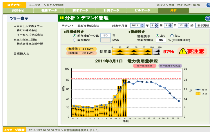
図2 本システムの「見える化」の画面イメージ