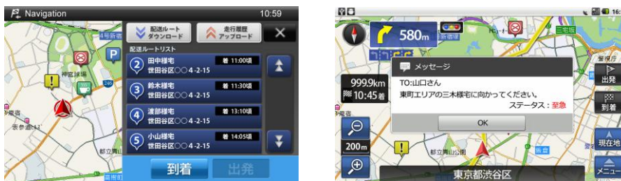
カスタマイズしたHMIの例(左:業務操作画面、右:メッセージ表示)

Android™ の Java 実行環境から Android™ ナビアプリが提供するナビ API を利用することにより、ナビ開発者でなくてもナビ機能呼び出し HMI をカスタマイズすることが容易です。