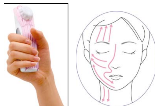
[図5 持ち方・動かし方]