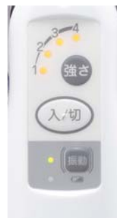
[図7 4段階の強弱モード・振動機能]