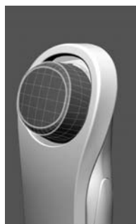
[図6 ラウンド形状新ヘッド]

ヘッド部分には、金属に敏感な肌の人でも使用できるよう「導電ゴム(合成ゴム)」を採用しています。また、肌密着面積を従来比約 1.4 倍*3 に拡大したラウンド形状の新ヘッドを採用することにより、小鼻にもフィットしやすくなり、効率よく肌の手入れができます。肌の調子に合わせて調節可能な、表示ランプ付きの「4段階の強弱モード」も前機種 NC-550 から引き続き採用し、今回新たに好みで選べる振動機能を追加するなど、女性の繊細な肌にもやさしく、安心して使用できるよう、使い勝手を向上させています。