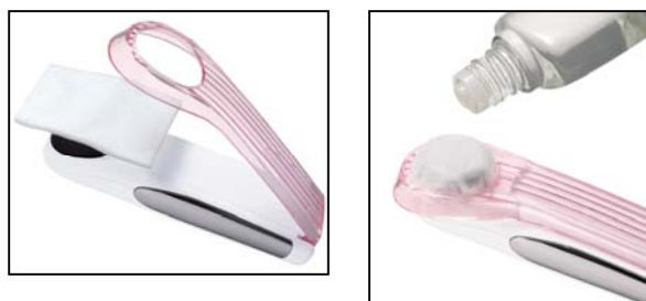
[図4 化粧用コットンの装着方法]

「フェイスクリエ」の使用方法はとても簡単です。クレンジング剤でメイクを落として洗顔をした後、「フェイスクリエ」のヘッド部分に化粧用のコットンをかぶせ、カバーを閉じてコットンに化粧水をしみ込ませます。電源を入れ、本体両サイドのサイドプレートに手が触れるように持ち、コットンを肌に軽く当てて、顔の中心から外側へ滑らせるように、目のまわりを除く顔全体を 3 分間やさしくクレンジングします。化粧水はふだん使っているもので大丈夫ですが、汚れ落ちがあまり感じられない場合は、ふき取り用の化粧水の使用をおすすめします。