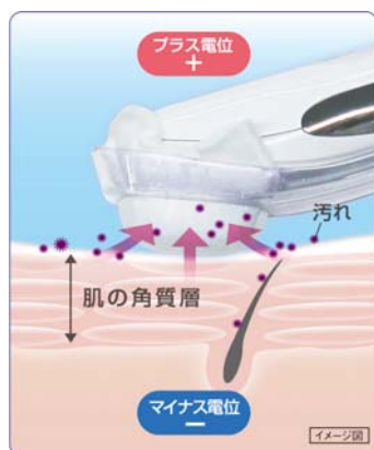
[図1 クレンジングのイメージ]

クレンジングと洗顔を併用しても落ちにくい毛穴の奥の微細な汚れは、無理にこすると肌にダメージを与えることがあります。本製品は、プラス電位となる導電ゴム電極を持つヘッド部分を肌に当て、マイナスにイオン化された毛穴の奥の汚れ(外気の汚れや皮脂、古い角質、化粧成分などの汚れ)を引き出し、肌にやさしく汚れを落とします。毎日気軽に続けられ、コットンについた汚れで、毛穴の奥の汚れがとれたことを実感できます。