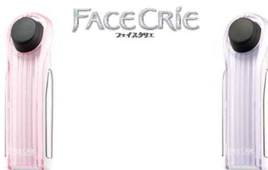
クリスタルピンク(P)