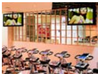
スポーツクラブ(会員向け情報)