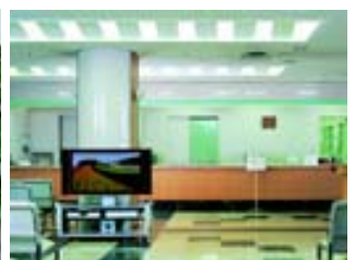
公共スペース(地域情報)