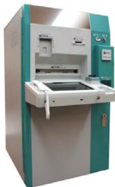
自治体向け多機能システム「CommunityStation-EX」