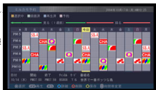
【ミルカモ予約画面】

見るかもしれない番組をHDDにどんどん録画し、録画番組が簡単に検索・再生できる日立独自の「ミルカモ予約」機能を搭載しています。本機に搭載の「ミルカモ予約」はEPGと連動し、タイトル情報などを自動入力することができます。連続ドラマなど、毎週同じスケジュールで放送される連続番組の予約録画に便利な機能です。