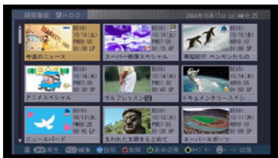
【サムネイル表示画面】

録画日時やチャンネル、タイトル等をもとに番組の検索に便利なディスクナビゲーション機能を搭載。ディスクナビゲーションは画像を見ながら視覚的に映像を検索するサムネイル表示モードと、文字情報を見ながらすばやく検索できるリスト表示モードを搭載しています。