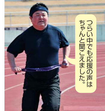
つらい中でも応援の声はちゃんと聞こえました。