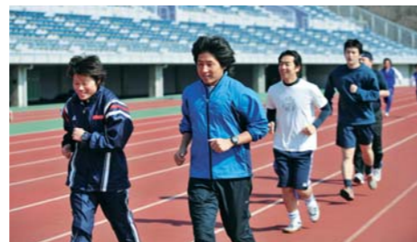
軽く1周(400m)を走るチャレンジャーたち。まだ余裕の表情。