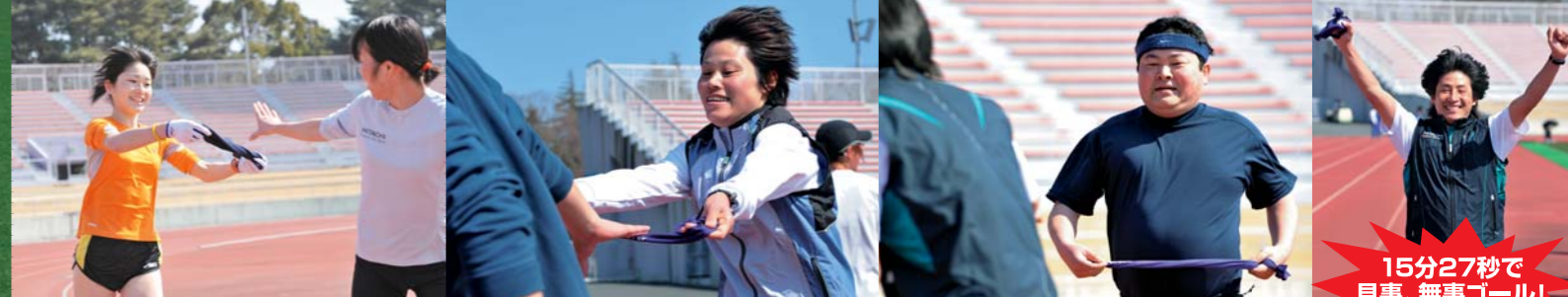
タスキリレーは相手に受け取りやすく!