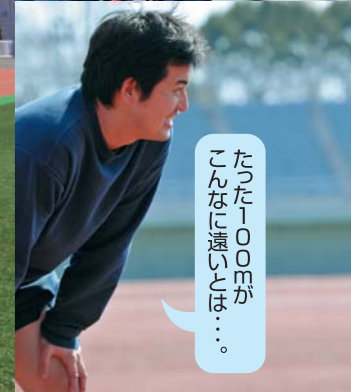
たった100mがこんなに遠いとは...