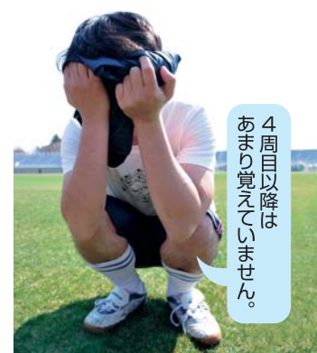
4周目以降はあまり覚えていません。