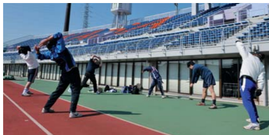
ケガのないようにウォーミングアップ。