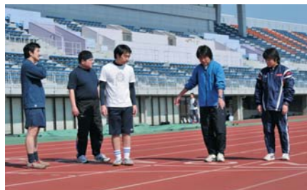
足の着地は足の裏全体で。