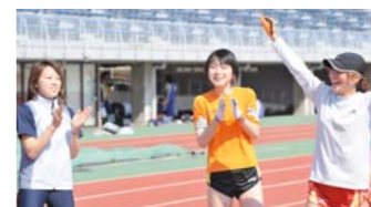
陸上部チームは13分30秒の世界記録(?)ゴール!!

会場●茨城県笠松運動公園陸上競技場 当日のコンディション●天候:快晴 気温:15.7℃ 湿度:33% 風:なし