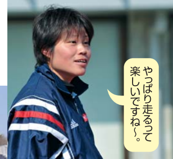
楽しいですね。走り出すと。