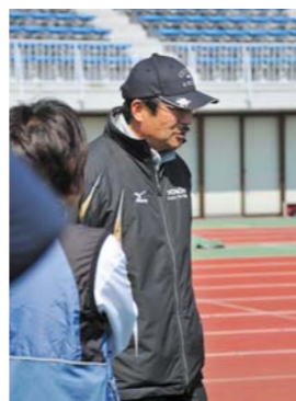
櫻井総監督も興味津々。

現役を引退から6年、現在はメタボリックの一步手前ですが肉離れに気をつけながら、5人で協力して何とか16分を切りたいと思います。