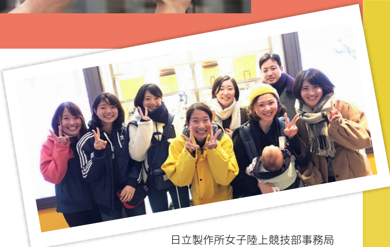
日立製作所女子陸上競技部事務局