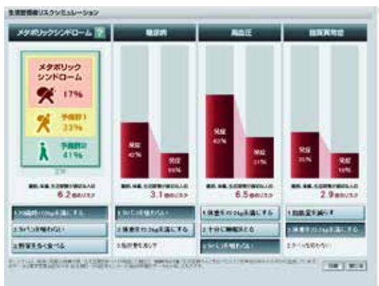
メタボ・ジャッジ