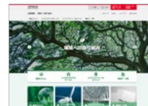
Web 環境への取り組み http://www.hitachi.co.jp/environment/