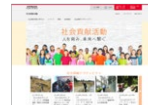
Web 社会貢献活動 http://www.hitachi.co.jp/csr/sc/

※ その他、「コーポレートガバナンス報告書」でも日立製作所の情報を開示しています