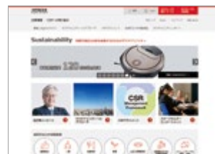
Web CSRへの取り組み http://www.hitachi.co.jp/csr/