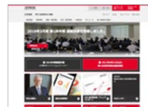
Web 株主・投資家向け情報 http://www.hitachi.co.jp/IR/

※ その他、「有価証券報告書」「事業報告書」などでも日立製作所の情報を開示しています