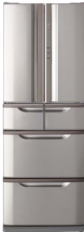
R-SF42VM(SR)ステンレスローズ http://kadenfan.hitachi.co.jp/rei/lineup/r-sf42vm/index.html