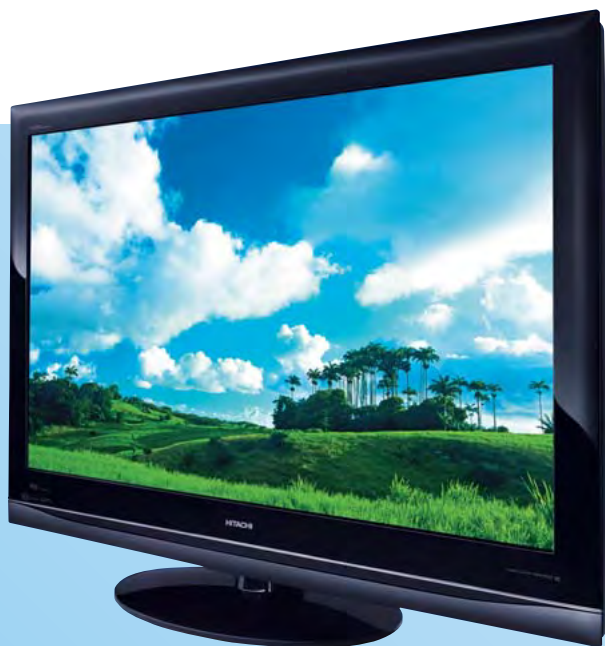
*写真はPMT-5040XGと卓上スタンドTP-5030MST(別売)との組み合わせです。