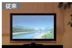
従来 青白・緑色っぽく、メリハリのない映像

「インテリジェント・センサー」が部屋の明るさや照明の色合いを検知。最適な高画質に自動調整しながらムダな電力を低減します。*アナログRGB入力時は、部屋の明るさのみを検知して調整します。