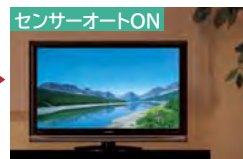
センサーオートON 自然な色合いで見やすい映像に