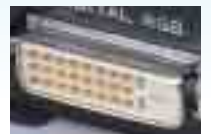
写真は、別売オプションビデオカードCMPAV05です。

DVIはパソコンデータにのみ対応する端子で、コピープロテクションには対応しません。