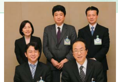
株式会社 近畿大阪銀行 営業企画部 情報リレーション部の皆さま