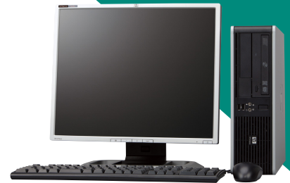
<液晶モニタは別売です>

従来シリーズより約17% (dc5700SF/CTとの体積比) の省スペース性を実現した筐体を採用。また、コンパクトでありながら拡張スロットを4スロット装備し、拡張性も確保しています。