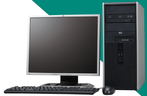
<液晶モニタは別売です>