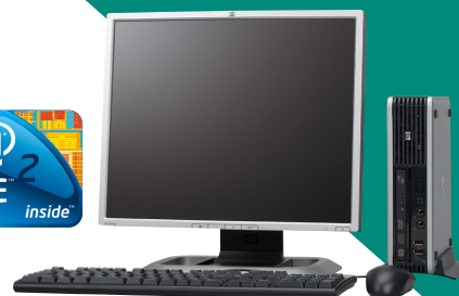
<液晶モニタは別売です>