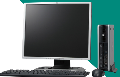
<液晶モニタは別売です>

省電力性に優れたチップセットやプロセッサを採用することでパフォーマンスを高めながら省電力性・CO2排出量抑制を実現。電源変換効率80%以上の基準を満たした80PLUS電源の採用で国際エネルギースタープログラムの最新基準 (ENERGY STAR Version 4.0) に適合。環境意識の高いお客さまにふさわしいシステムを提供します。