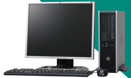
<液晶モニタは別売です>