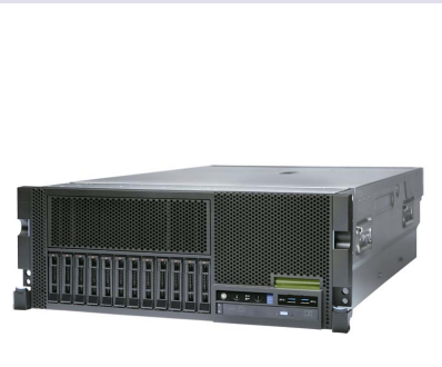
ラックマウントモデル

SSD: Solid State Drive *周辺装置拡張筐体であるI/Oドロー接続時