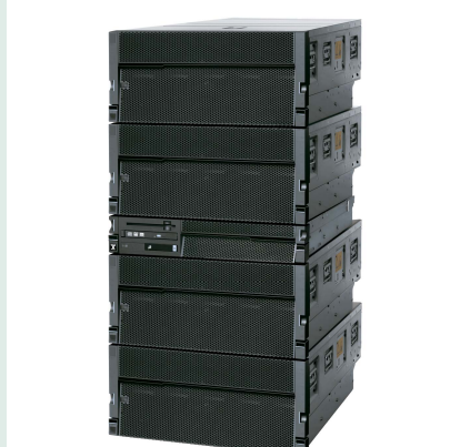
ラックマウントモデル