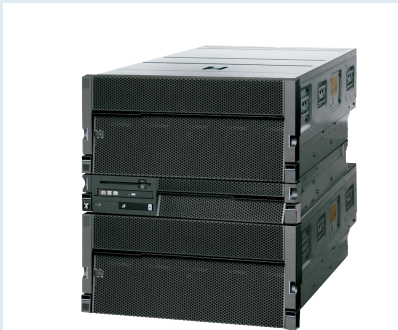
ラックマウントモデル