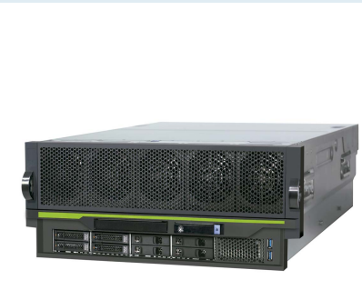
ラックマウントモデル

CUoD: Capacity Upgrade on Demand *周辺装置拡張筐体であるI/Oドロー接続時