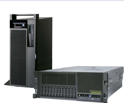
タワーモデル ラックマウントモデル