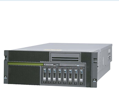
ラックマウントモデル