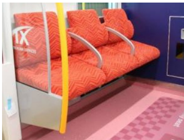
ユニバーサルシート