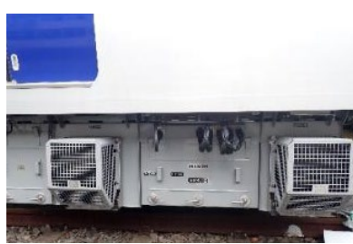
主制御装置に SiC 素子を適用