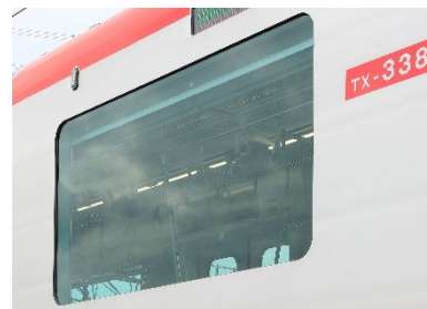
UV カットグリーンガラス