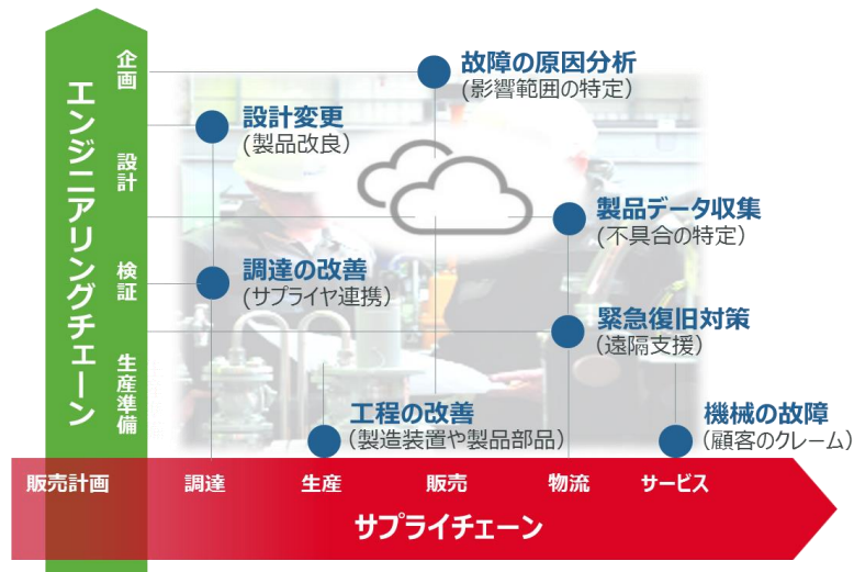
バリューチェーン全体の製品トレーサビリティ確立のユースケースイメージ図