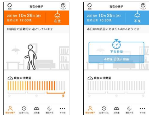
[図1 現在の様子(開発中の画面イメージ)]

新サービスでは、単身高齢者の部屋の壁などに活動センサーを設置し、24時間365日、在室状況や活動量を検知します。検知した情報は無線LANルーターを通じて、サーバーに蓄積します。家族は、専用のスマートフォンアプリ(*1)を通じて、単身高齢者の様子をリアルタイムで確認できます(図1)。今後は、日立の接続家電(*2)との連携も検討します。