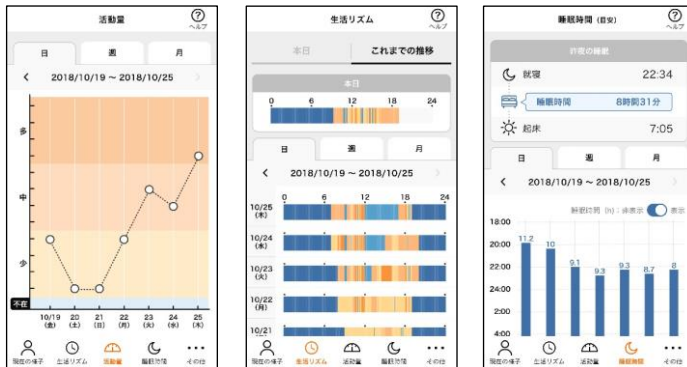
[図2 生活リズム・活動量・睡眠時間の履歴(開発中の画面イメージ)]

また、日立グループが有するITのノウハウを生かした情報解析技術により、不在や静止状態が一定時間継続した場合などには、家族に異変をお知らせする機能(図3)も採用します。