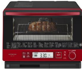
メタリックレッド(R)