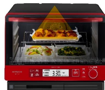
イメージ図 [図 3 おかずセットの調理例]

新たに採用した「おかずセット」メニューは、主菜 1 品、副菜 2 品を一度にまとめて同時に調理(図 3)するので手間が省けます。「W スキャン調理」で重さと温度に合わせて火加減するので、最大 4 人分まで分量設定することなく調理ができます (*)3 。「おかずセット」の主菜と副菜は、各 7 種類から選べ、その組み合わせは 147 通りになります。その中で、「女子栄養大学 栄養クリニック」 (*)4 がおすすめする、主菜 1 品、副菜 2 品の計 3 品で 400kcal 以下に抑えられる「ヘルシーおかずセット」が 7 通りあります。