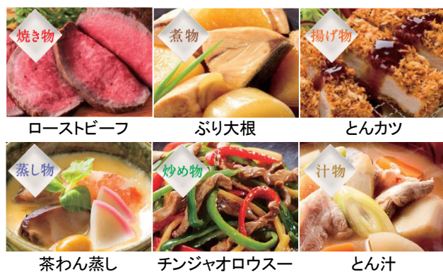
イメージ図 [図 2 W スキャン調理のオートメニュー例]

その火加減を食品の重さと温度に合わせてオートでコントロールする「W スキャン調理」を 93 メニュー採用しました。焼き物・煮物・揚げ物・蒸し物・炒め物・汁物など多彩なメニュー(図 2)をおいしく調理します。例えば、ローストビーフでは、最初にレンジですばやく肉の内部温度を上げ、続いてオープンと、より強い火力の過熱水蒸気の加熱で表面を焼き、肉の旨みを閉じ込めます。最後にオープンで包み込むように表面をじっくり焼いて、内部には火が入り過ぎないように仕上げます。