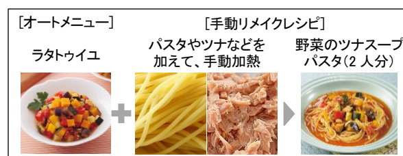
〔図 7 ラタトウイユのリメイク例〕